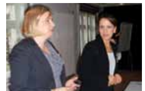
Als durchweg positiv wurden die Form der Zusammenarbeit und der enge Kontakt im Konsortium bewertet.